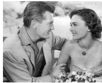
1953 LE GUÉRISSEUR d'Yves Ciampi avec Danièle Delorme