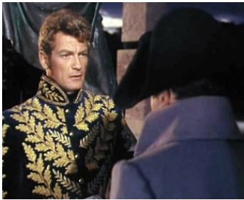
1954 NAPOLÉON de Sacha Guitry avec Raymond Pellegrin