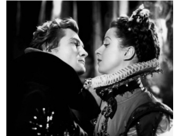
1946 RUY BLAS de Pierre Billon avec Danielle Darrieux