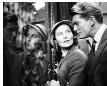
1950 LE CHÂTEAU DE VERRE de René Clément avec Michèle Morgan