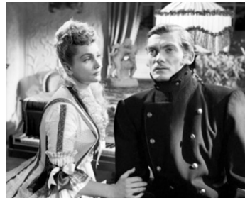
1948 LE SECRET DE MAYERLING de Jean Delannoy avec Claude Farell