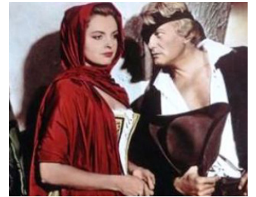
1957 LA TOUR, PRENDS GARDE de Georges Lampin avec Eleanora Rossi-Drago