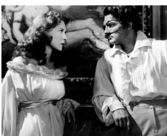
1951 NEZ-DE-CUIR d'Yves Allégret avec Mariella Lotti