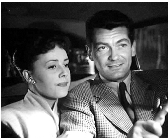
1953 JULIETTA de Marc Allégret avec Jeanne Moreau