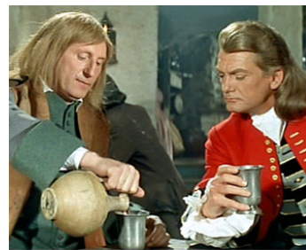
1959 LE BOSSU d'André Hunebelle avec Bourvil