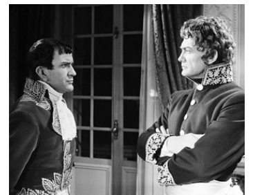
1959 AUSTERLITZ d'Abel Gance avec Pierre Mondy