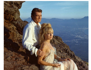
1965 FANTÔMAS SE DÉCHAÎNE d'André Hunebelle avec Mylène Demongeot