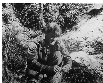
1952 LA MAISON DU SILENCE (La Consciencia acusa) de Georg-Wilhelm Pabst