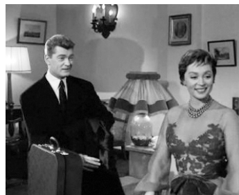
1958 LA VIE À DEUX de Clément Duhour avec Lilli Palmer