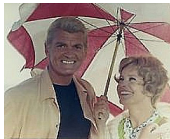
1969 LA PROVOCATION d'André Charpak avec Maria Schell