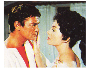
1961 PONCE-PILATE (Ponzio Pilato) d'Irving Rapper & G. P. Callegari avec Jeanne Crain