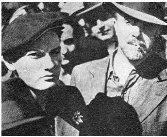
1933 L'AVENTURIER de Marcel L'Herbier avec Victor Francen