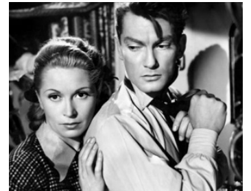
1948 LES PARENTS TERRIBLES de Jean Cocteau avec Josette Day