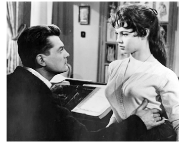
1955 FUTURES VEDETTES de Marc Allégret avec Brigitte Bardot