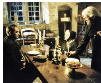
1994 LES MISÉRABLES de Claude Lelouch avec Jean-Paul Belmondo