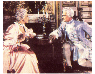
1954 SI VERSAILLES M'ÉTAIT CONTÉ de Sacha Guitry avec Micheline Presle