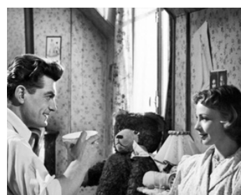
1952 LES AMANTS DE MINUIT de Roger Richebé avec Dany Robin