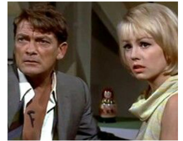
1966 FANTÔMAS CONTRE SCOTLAND YARD d'André Hunebelle avec Mylène Demongeot