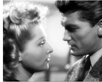
1943 VOYAGE SANS ESPOIR de Christian-Jaque avec Simone Renant