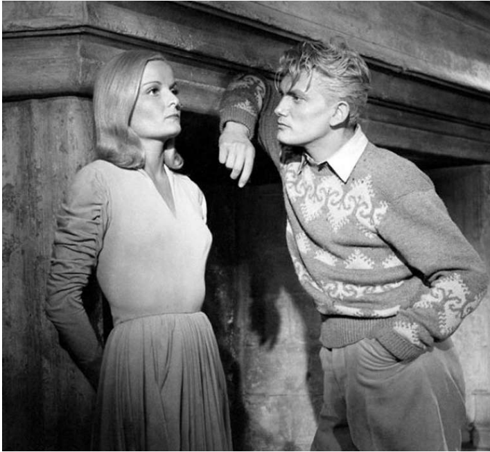
1943 L'ÉTERNEL RETOUR de Jean Delannoy avec Madeleine Sologne