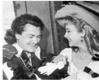
1962 LE MASQUE DE FER d'Henri Decoin avec Giselle Pascal