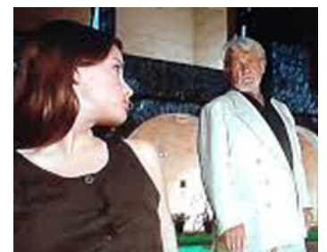
1995 BEAUTÉ VOLÉE (Stealing Beauty) de Bernardo Bertolucci avec Liv Tyler