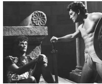
1961 L'ENLÈVEMENT DES SABINES (Il Ratto delle Sabine) de Richard Pottier avec Roger Moore