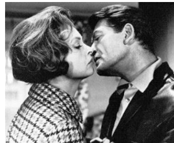
1965 PLEINS FEUX SUR STANISLAS de Jean-Charles Dudrumet avec Nadja Tiller