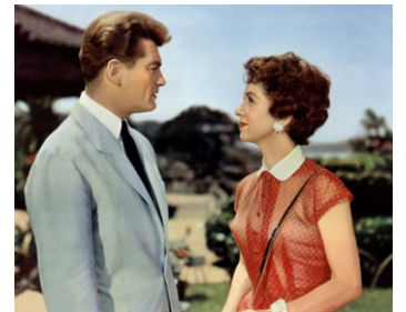
1956 TYPHON SUR NAGASAKI d'Yves Ciampi avec Danielle Darrieux