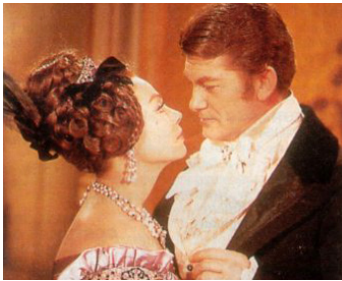
1962 LES MYSTÈRES DE PARIS d'André Hunebelle avec Dany Robin