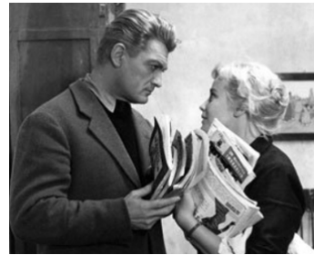
1957 NUITS BLANCHES (Me notti bianche) de Luchino Visconti avec Maria Schell