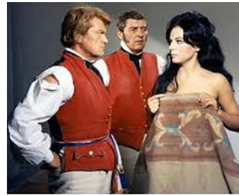
1966 SEPT HOMMES ET UNE GARCE de Bernard Borderie avec Ettore Manni, Marilu Tolo