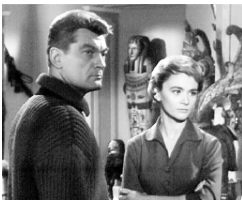
1958 CHAQUE JOUR A SON SECRET de Claude Boissol avec Danièle Delorme