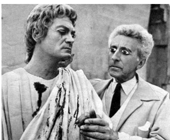
1959 LE TESTAMENT D'ORPHÉE de Jean Cocteau avec Jean Cocteau