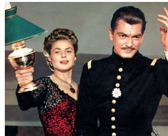
1956 ÉLÉNA ET LES HOMMES de Jean Renoir avec Ingrid Bergman