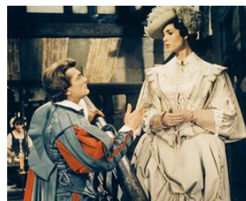
1960 LE CAPITAN d'André Hunebelle avec Elsa Martinelli