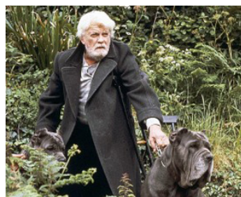
1991 LES ENFANTS DU NAUFRAGEUR de Jérôme Foulon