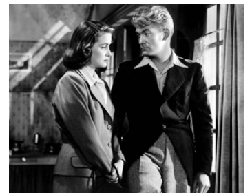
1950 LES MIRACLES N'ONT LIEU QU'UNE FOIS d'Yves Allégret avec Alida Valli