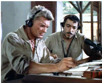
1956 S.O.S. NORONHA de Georges Rouquier avec José Lewgoy