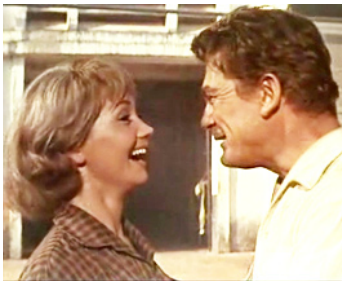
1964 LE GENTLEMAN DE COCODY de Christian-Jaque avec Liselotte Pulver