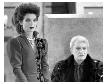
1985 PARKING de Jacques Demy avec Marie-France Pisier