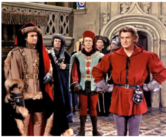
1961 LE MIRACLE DES LOUPS d'André Hunebelle avec Roger Hanin