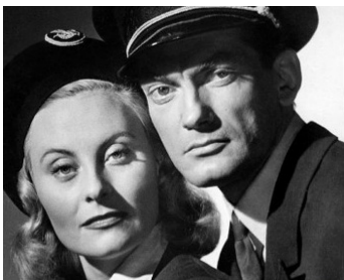
1948 AUX YEUX DU SOUVENIR de Jean Delannoy avec Michèle Morgan