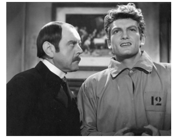
1942 LE LIT À COLONNES de Roland Tual avec Fernand Ledoux