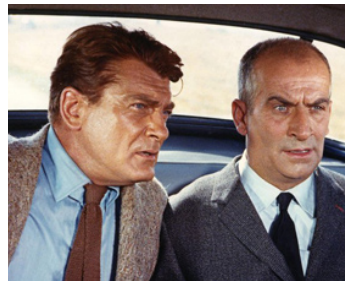
1964 FANTÔMAS d'André Hunebelle avec Louis De Funès