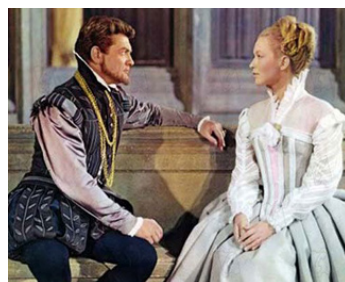
1960 LA PRINCESSE DE CLÈVES de Jean Delannoy avec Marina Vlady