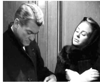
1963 L'HONORABLE STANISLAS, AGENT SECRET de Jean-Charles Dudrumet avec Geneviève Page