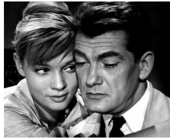
1957 UN AMOUR DE POCHE de Pierre Kast avec Geneviève Grad