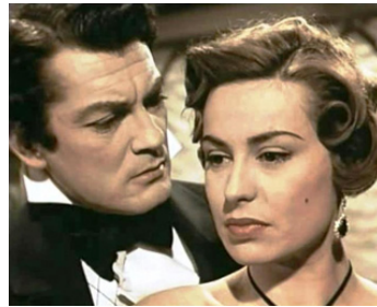
1954 LE COMTE DE MONTE-CRISTO de Robert Vernay avec Antonella Lualdi