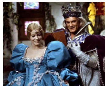
1970 PEAU D'ÂNE de Jacques Demy avec Catherine Deneuve